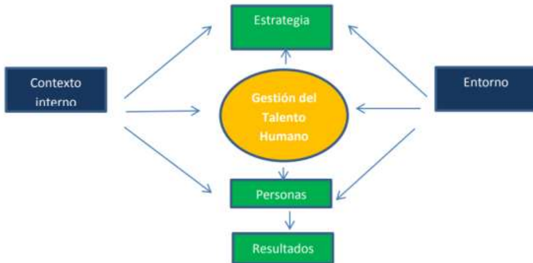
Figura N° 1. Modelo Integrado de Gestión Estratégica del Talento Humano adaptado de Serlavós, tomado de: (Longo, 2002 pág. 11)