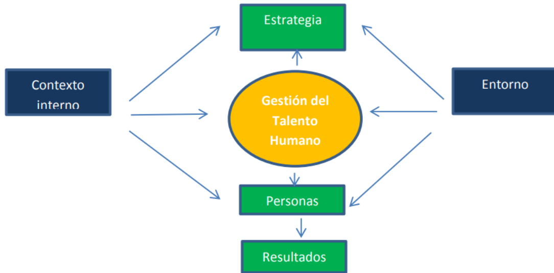
Figura N° 1. Modelo Integrado de Gestión Estratégica del Talento Humano adaptado de Serlavós, tomado de: (Longo, 2002 pág. 11)